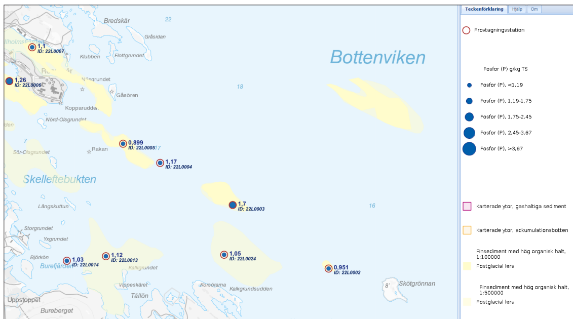
Del ur kartvisaren, som visar fosforhalterna i Skelleftebukten.

och enstaka kartläggningar. Uppdraget avser både marina data och data avseende insjöar och vattendrag. I denna kartvisare visas, som komplement till SGUs provtagningsstationer, lägen för de provtagningsstationer som används för miljöövervakning av sediment. Ytterligare information är nedladdningsbar via kartvisaren Miljöövervakning, havs- och sjösediment .