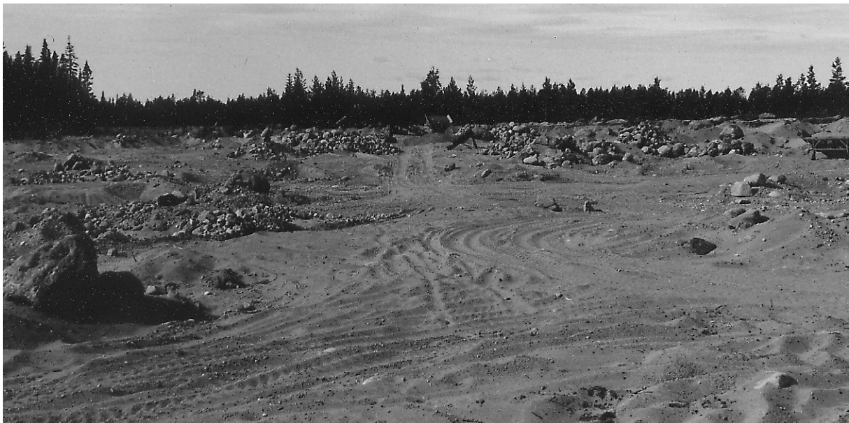
Fig. 2. Svallgrus öster om Gumboda (21L 6 b). Sedimentets ringa mäktighet, ca 2 m till morän eller berg, har medfört att täktverksamheten tagit stora ytor i anspråk i den flacka terrängen.