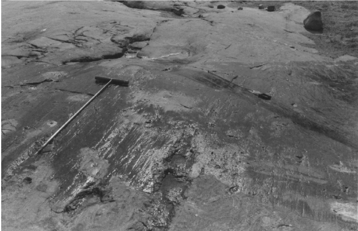
Fig. 9. Rundhäll på Granskäret (21L 5a). Bilden är tagen mot sydost på hällen som är räfflad och formad av is som rört sig från N25°V (spjutets riktning). En sydligt sluttande fasettyta är polerad och räfflad från väster (kompassens riktning) under en äldre isrörelse.

Gumbodafjärden (21L 6b) finns ett flertal räffelriktningar i detta intervall, med en ålder som ökar ju östligare räffelriktningen är.