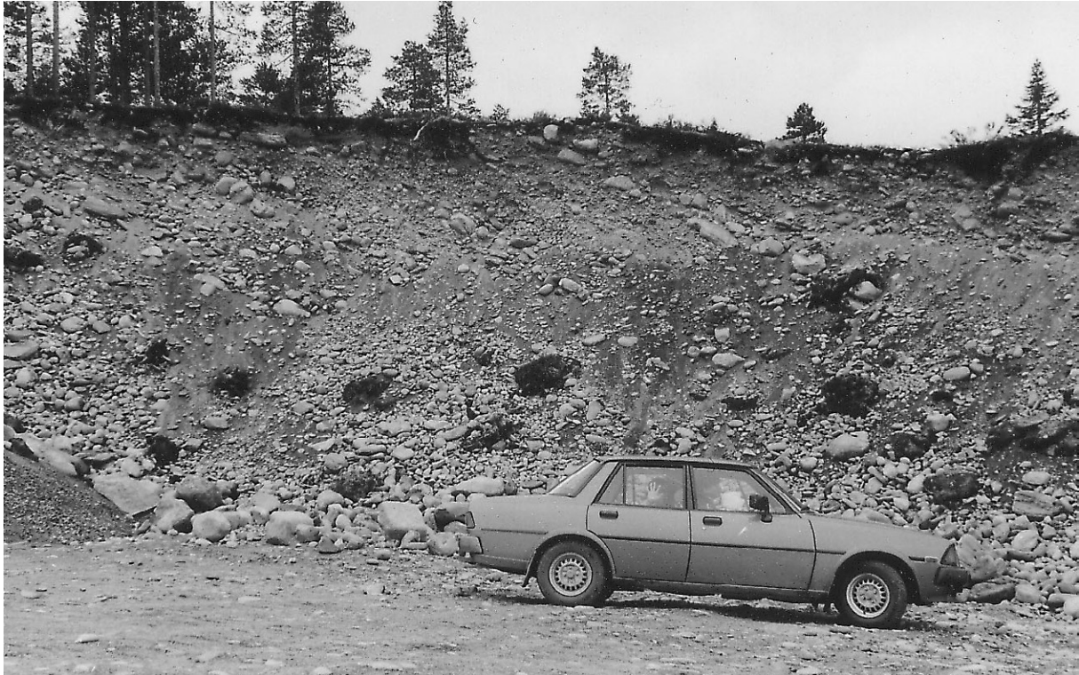
Fig. 1. En ca 8 m mäktig svallgrusackumulation i Varmvattsbergets nordvästsluttning (21K 3 a). Svallsedimentens mäktighet är vanligen störst på den sidan av bergen som legat i lä för vind- och vågexposition i det forna havet, i detta fall nordvästsidan.