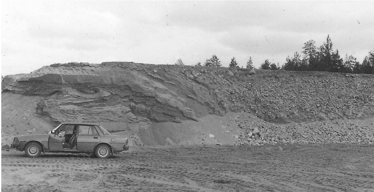
Fig. 3. Sävarheden, som isälvsavlagringen söder om Bullmark benämns, är flack till följd av kraftig svallning. Den ca 6 m höga skärningen nära södra kanten av kartområdet (21K 0 g) visar strömskiktad isälvs sand med skarp gräns till välrundat, stenigt isälvsgrus, "rullstensgrus".

flack och kraftigt påverkad av svallning (fig. 3). Serier av vackra strandvallar täcker delar av avlagringen. Materialet är enligt flera skärningar sand och grus. De mot nordväst strävande ryggformade utlöparna från Sävarheden utgörs av forna strandsporrar. Materialet i dessa är i huvudsak grus. Mellan Bullmark och Botsmark bildar avlagringen en ås, som omges av yngre älv- och svallsediment. Norr om Gravmark är avlagringen helt täckt av yngre sediment eller borteroderad. Mellan Bullmark och Gravmark består avlagringen till stor del av grus. Norr om Gravmark växlar materialsammansättningen mellan sand och grus.