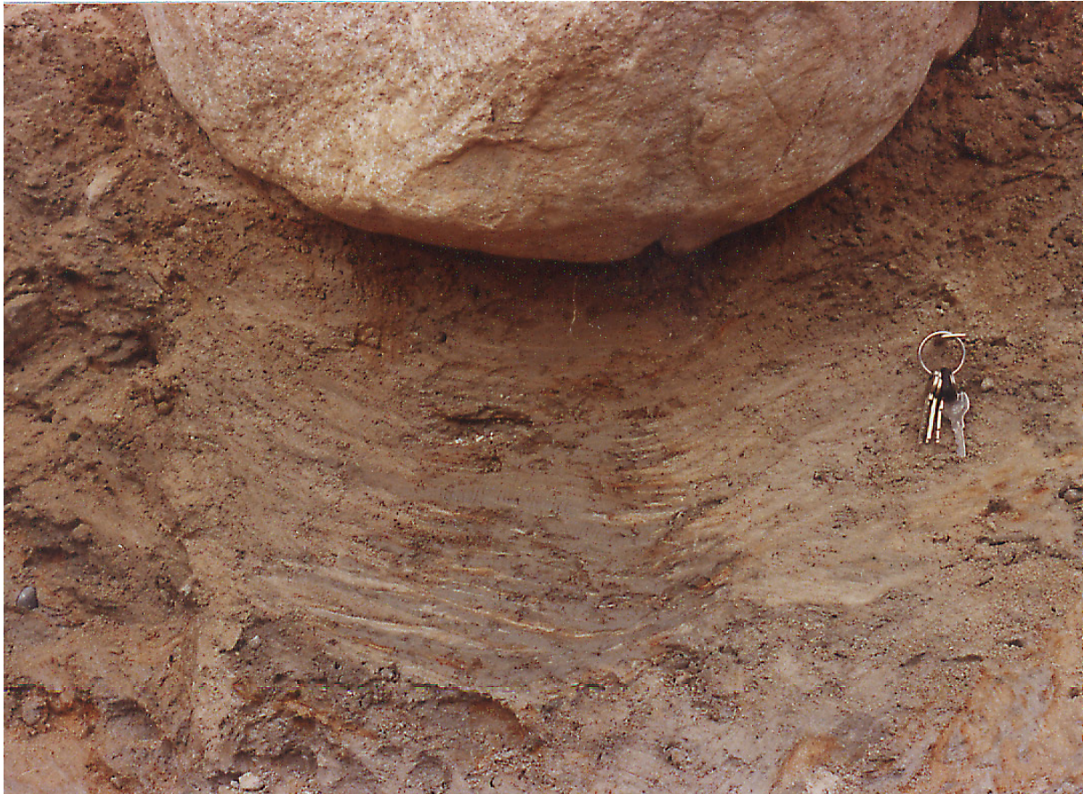
Fig. 4. Tjällyftning av ett 0,5 m brett, ca 1 m högt moränblock vid observationspunkt nr 19, Kåtasjön. Blockets nedre halva har legat nedbäddat i ett kompakt moränlager (lager b, se karta 2). Frysning av markvatten i det porösare ytligare moränlagret (lager a), har i omgångar lyft blocket totalt ca 0,4 m. Under blocket har silt och lera sedimenterat i skikt i takt med lyftningen.