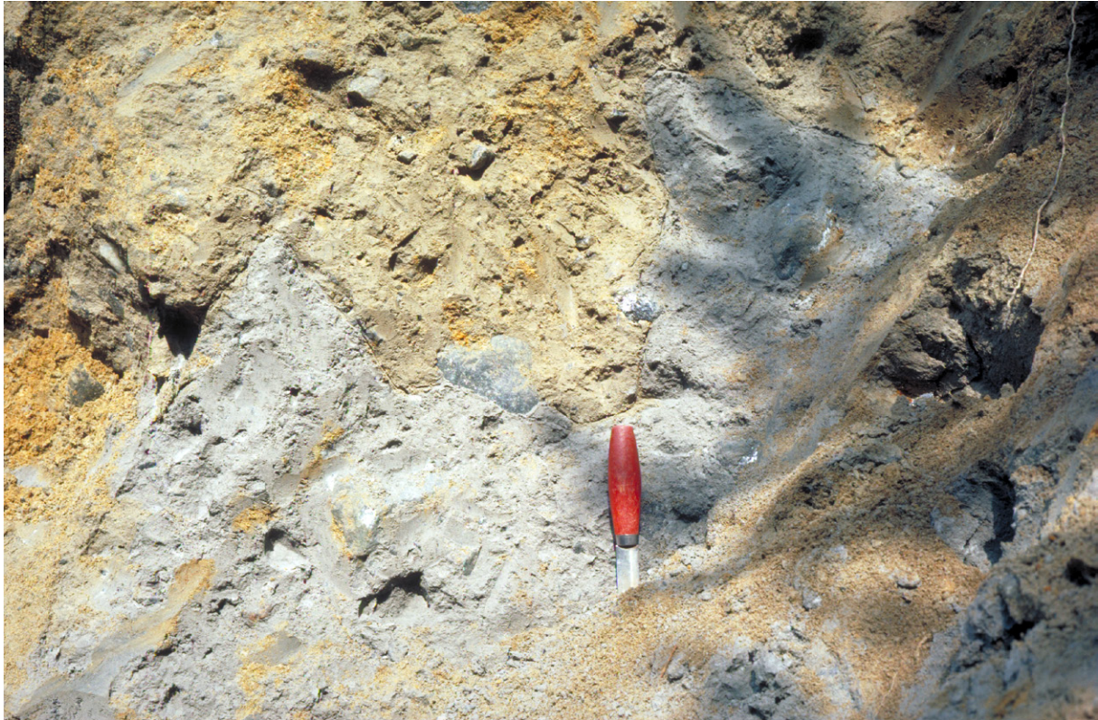
Fig. 11. Gränsen mellan moränlagren b och c är skarp men ibland ojämn eller uppsprucken och trasig med införlivade brottstycken från morän c i morän b. Denna tandformade gräns mellan lagren vid grop nr 35, Mjösjön, (21K 1h) har sannolikt uppkommit när morän c, åtminstone ytligt varit frusen och uppsprucken när nästa isframstöt avsatte moränlager b.

avlagringar ofta domineras av sand. För närmare information om isälvavlagringarnas kornstorlekssammansättning hänvisas till avsnittet om isälvssediment. Svallsedimentens och älvsedimentens sammansättning redovisas i kartan.