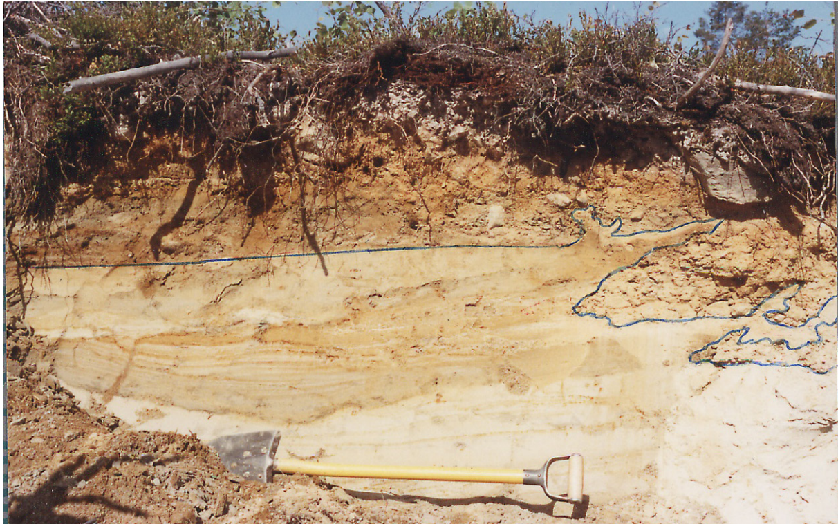
Fig. 7. Seismiska rörelser är sannolikt orsak till denna lagerföljd. Deformerad och delvis omlagrad isälvsand har överlagrats av ett flytlager av morän som från högre nivå glidit utför Selslidens nordsluttning. Bild från grop 18 (21K 2a).

Den enda förkastning av ovan angivet slag som påträffats inom kartområdet 21K Robertsfors / 21L Ånäset kan följas från Bjänträsket (21K 7 d), strax norr om Botsmark, mot nordost till Bygdeträsket. Utanför kartområdet fortsätter den till Burträsk (Rodhe m.fl. 1990).