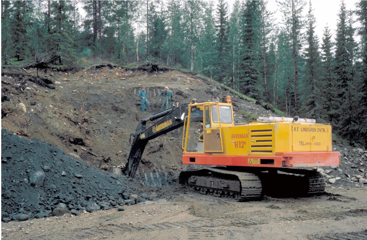
Fig. 10. Skärning i moränslänt vid grop nr 13 Hundtjärnliden (21K 8 a). En meter brun morän (lager b) överlagrar mer än 10 m bottenmorän (lager c) som är grå över grundvattnenytan och mörkt blågrå under. Den naturliga sluttningen som syns bakom grävmaskinen är frameroderad av vattenerosion och utgör ena kanten av en isälvsränna.

Under en eller två moräner (morän a och b eller en av dessa) förekommer på många platser en brungrå till grå, ibland blåaktig morän med varierande sammansättning (morän c). Ofta finns ett betydande inslag av mo–mjåla (silt) och lerskikt. Partikelorienteringar tyder på isrörelser från ungefär nord till nordväst. Gränsen mot överliggande morän är i regel skarp (fig. 11).