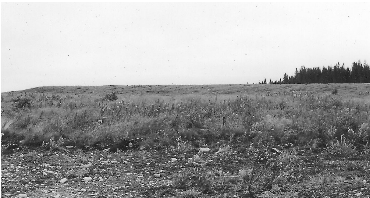
Fig. 5. Långsträckt drumlinliknande moränrygg orienterad i nordnordväst–sydsydost. Ryggen kan betecknas som en läsidesmorän eller "crag and tail" avsatt sydsydost om en bergkärna (i bildens vänstra kant) på Jämtlandskälen (21K 5 b).