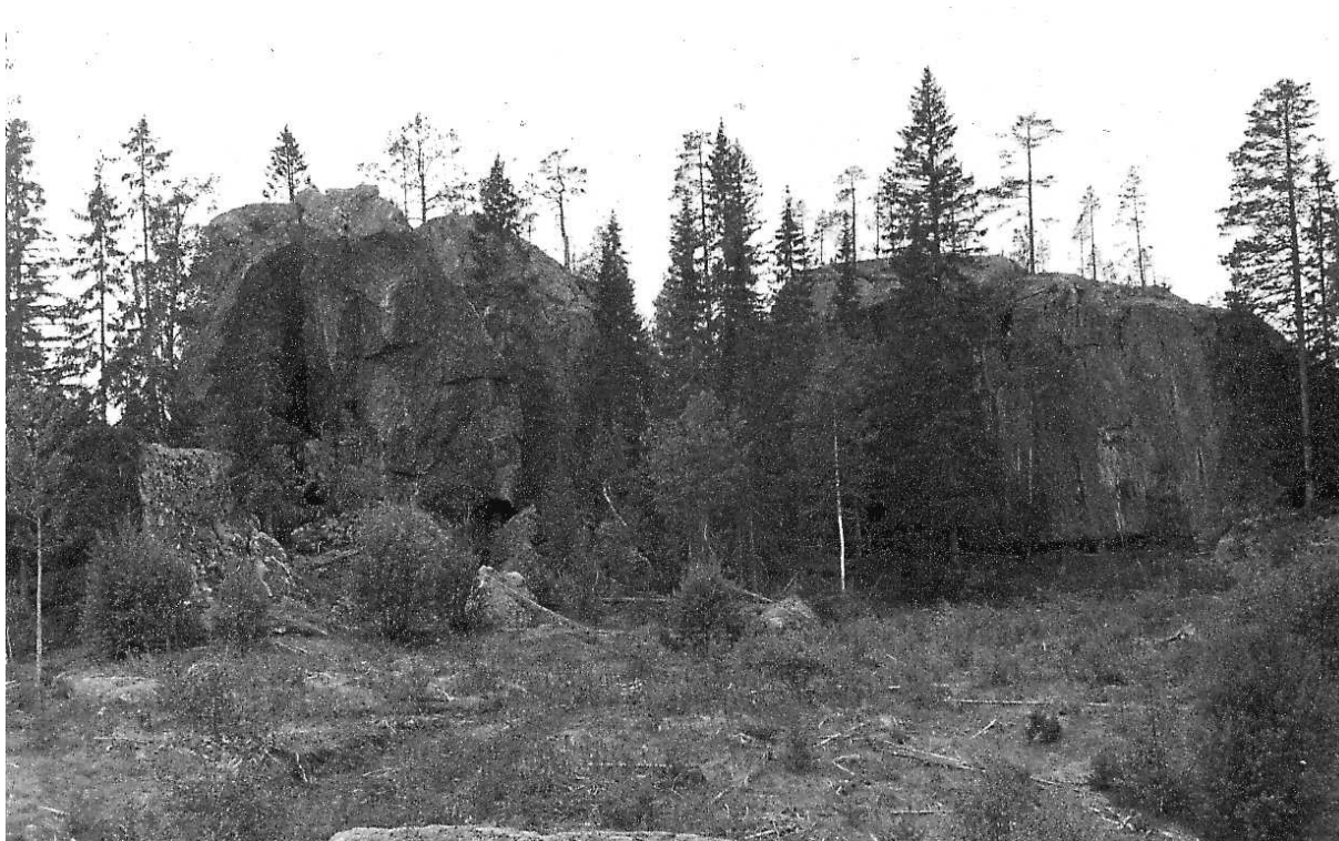
Fig. 6. "Botsmarksstenen" är en klunga med mycket stora, kantiga block. Det största, till höger i bilden, är ca 12 m högt och torde väga uppemot 25 000 ton. Blocken har förmodligen på grund av sin storlek endast flyttats några meter från sitt ursprung – en liten bergshöjd.