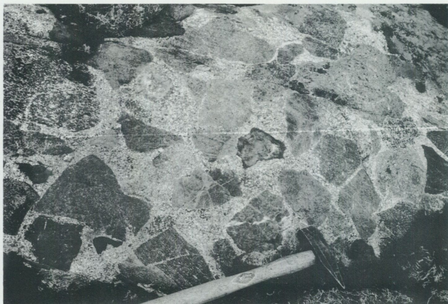
Fig. 9. Rikligt brottstyckesförande eruptivbreccia av gabbro, ultrabasit och metadacit i tonalit. – 3 km SO om Myra (Östhammar SO, 0j).

dermera Lundegårdh vidare med ingående undersökningar först av Grovstanäsmassivet (1941 och 1943) men därefter också av ett flertal andra ultrabasiska massiv i Roslagen (1947). Till skillnad från övriga, vanligtvis ordinära, äldsta hornbländegabbror inom kartregionen ansåg Lundegårdh, i motsats till tidigare geologer, den ultrabasiska gabbbron vara betydligt yngre än omgivande gnejsgraniter och intruderad i ett intraorogent skede mellan två deformationer. Denna åsikt motsades dock i högsta grad av kontaktrelationerna mellan den nämnda gabbbron och granitoiderna, vilka senare är klart breccierande (jfr Stålhös 1972). Nyare zirkondateringar på svekokarelska gabbrobergarter och granitoider från södra Finland antyder dock närmast synkrona åldrar för dessa bergartsled, samtliga belägna inom tidsintervallet 1 880–1 890 milj. år (jfr Stålhös 1991). Teorin om magmablandningar, dvs. det samtidiga inträngandet av basiska och sura magmor i berggrunden förefaller i högsta grad tillämplig här. Vissa iakttagelser inom Östhammarbladen (Stålhös 1991) och lokal förekomst av kontaktförtätad ultrabasisk gabbro i gränsen mot gnejsgranit (Andréasson 1970) kan antyda att de basiska massiven i dessa fall är yngre.