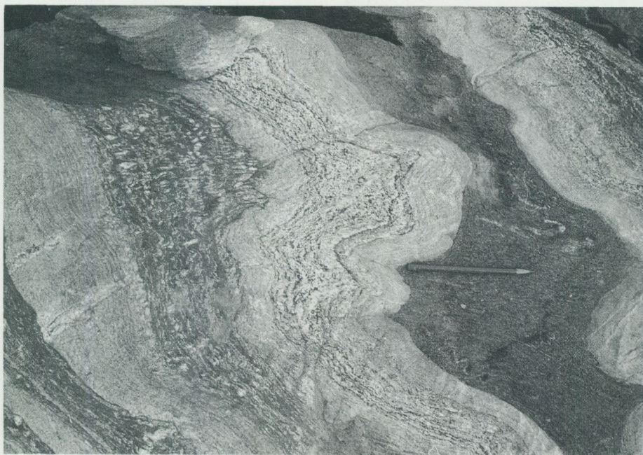
Fig. 6. Växellagring mellan välbevarade skikt av muskovit-biotitglimmerskiffer och plagioklaskvartsit (metaarenit). Ett konformt inlagrat basiskt skikt syns t. h. i bilden. En mot lagringen övertvårande axialplanförskiffring kan också noteras. – Kohagen, ca 3 km S om Sigridsholmsjön (Uppsala SV, 3e).

järnmalmerna inom Dannemorafältet. Mineraliseringar till följd av synorogen kontaktomvandling har påvisats i karbonatstenar, inneslutna såsom brottstycken i de äldsta granitoiderna t.ex. vid Gökö (Östh. SV, 4 b), med bildning av grossular och wollastonit i kontaktytan (Enberg 1932). Ännu högre omvandlingsgrad motsvarande pyroxen–hornfelsfacies representerar sannolikt en brucitförande karbonatsten i gränsen mot ett gabbromassiv invid Jonsgruvan (NO, 7 i) på Söderön, där bruciten antagligen bildats genom dissociation av en förutvarande dolomit (Stålhös 1991).