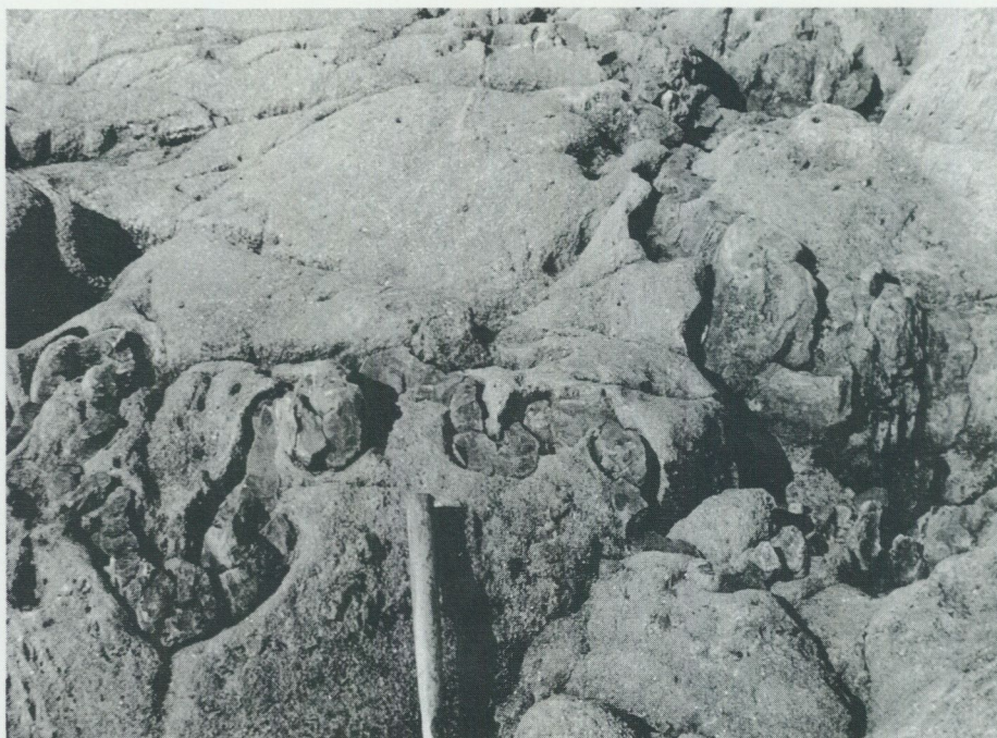
Fig. 5. Brant tvärveckade, små, tunna skikt av sur vulkanit i vit, kristallin kalksten. – Nothamn på Vaddö (Grisslehamn SV).

kalkstenar och övervägande natronbetonade vulkaniter, i detalj beskrivet av Magnusson (1940), är de stora vulkanitområdena utmed kusten på Vaddö och Singö tämligen dåligt kända (fig. 5). Dock dominerar här sura, ofta kalkstens- och skarnskiktade led ömsom välbevarade av hälleflintskaraktär, såsom på östra Singö, och ömsom mera rekristalliserade metavulkaniter, s. k. leptiter. De senare är speciellt vanliga strykande i nordvästlig riktning utmed kusten och något inåt land ända upp till i höjd med Forsmarks k:a (Östh. NO, 9 f).