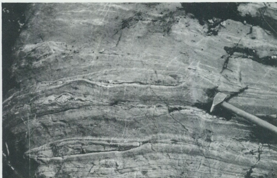
Fig. 3. Finskiktad, epidot-hornbländeskarnig, rödlätt ryolit. – 400 m SSO om Skållbo (Östhammar NV, 8e).

formig karaktär och möjligen utgörande tidigare lavar och ignimbriter, i området väster om Dannemora gruva (Östh. NV, 5 c). Kalibetonade vulkaniter dominerar däremot inom det nord-sydliga vulkanitstråket från Vattholmasynformen i söder (Östh. SV, 1 b), till norr om Dannemora gruvor. Vulkaniterna, företrädesvis de sura, är ofta associerade med malmer, men också med på många håll delvis skarnomvandlade kalkstenar och/eller dolomiter. Karbonatstenarna torde vara bildade genom kemiska utfällningar på grund av lokalt förhöjda kolsyrehalter i havet kopplat till vulkanismen. Även organiska processer i marin miljö kan ha medverkat, vilket bl.a. närvaron av kalkalger, s.k. stromatoliter antyder t.ex. i de mäktiga, malmförande dolomiterna i Dannemora gruva (Lager 1986).