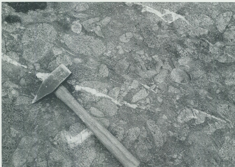
Fig. 4. Intraformationellt konglomerat med bollar av porfyr–porfyrnit och sur vulkanit. Berga, ca 1 km V om Vidbo k:a (Uppsala SV, 4e).

Basalter saknas däremot. Zirkondatering av de sura vulkaniterna här gav åldern 1\,891 \pm 10 miljoner år (Welin 1987) att jämföra med liknande zirkonåldrar i vulkaniter belägna under Grythytte- och Saxåsynkinalerna i centrala Bergslagen (Welin 1987, tab. 2).