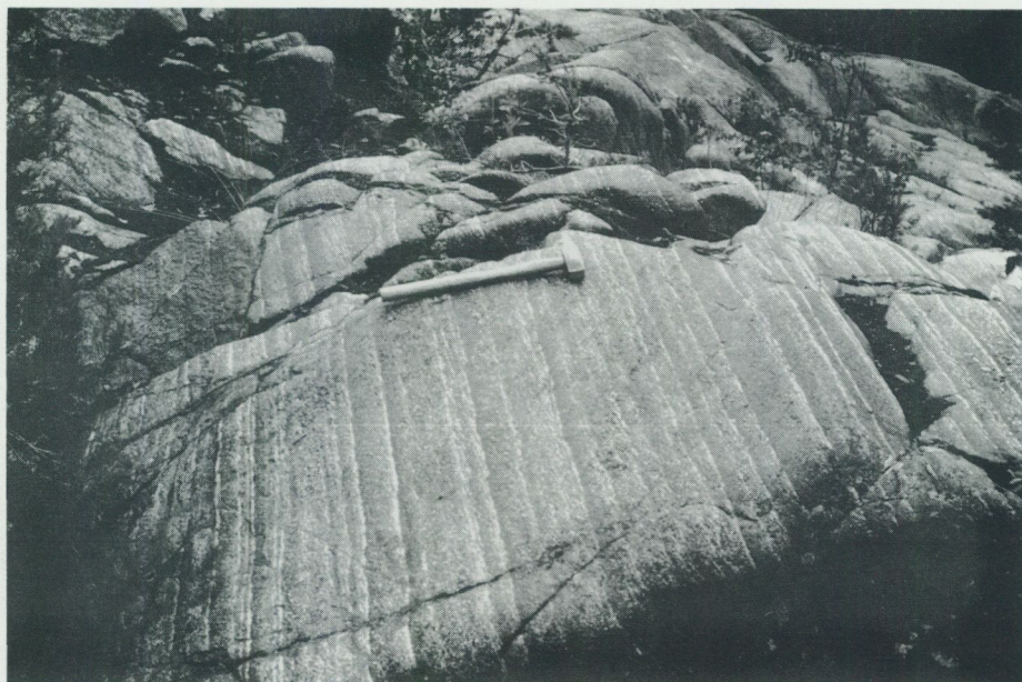
Fig. 10. Medelbrant stupande, graderad, rytmisk lagring i gabbro med uppåt t. h. i bilden. – S om stenbrottet vid Värmlandstorp, ca 2,5 km O om Gimo (Östhammar SO, 4g).

Gravitativ rytmisk bandning (fig. 10), en gång bildad i horisontell position, men nu ställd på kant genom de äldsta graniternas tektoniska påverkan, är en ganska vanlig företeelse inom flera massiv och kan ställvis utnyttjas för stratigrafiska uppåtbestämningar (Stålhös 1991).