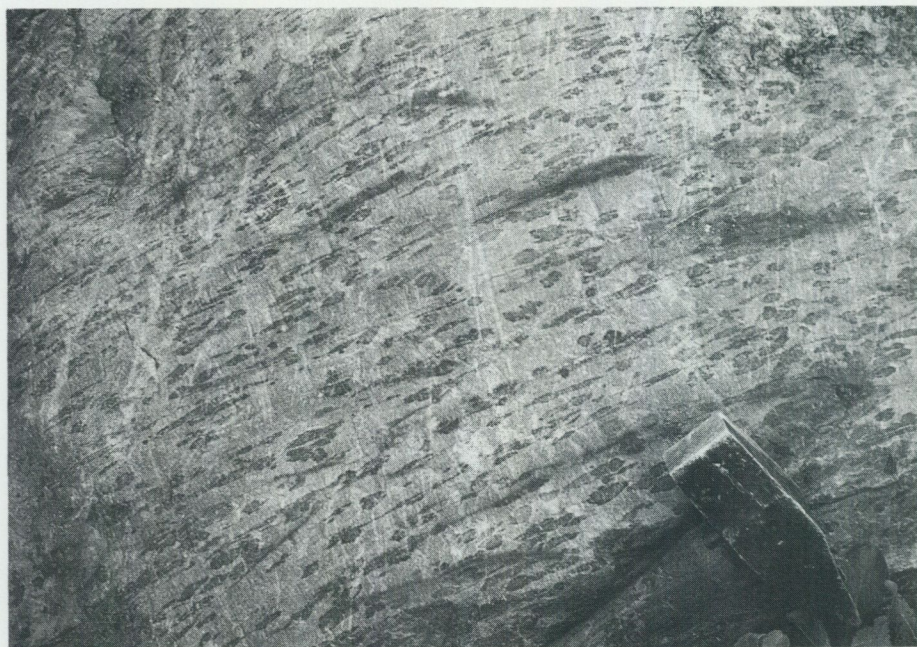
Fig. 7. Zonvis ansamlade cordieritpoikiloblaster i välbevarade metasediment. – 3 km NNO till N om Norrsunda k:a invid motorvägen (Uppsala SV, 2d).

nyssnämnda poikiloblaster, gav i den övriga sedimentberggrunden upphov till en ojämnt fördelad kvarts-fältspåtådring med bildning av granat och sillimanit samtidigt som delar av muskovitmineralet fortfarande kvarstår. Särskilt komplicerade blir förhållandena där de yngre graniterna från Vallentuna i söder och norrut väver igenom metasedimenten och där ådringen delvis kan härröra från dessa (fig. 8).