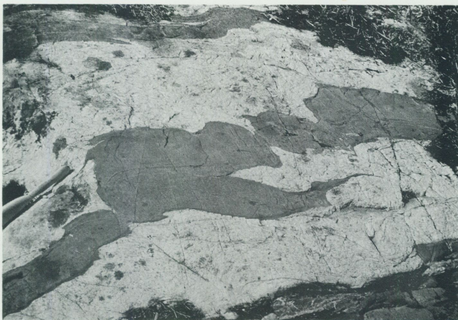
Fig. 14. Metabasitgång (Herrängsgång) konform med skiffriheten i omgivande, vitgrå gnejsgranit. – Vid Uppskedika, 400 m N om vägskal, ca 3 km VSV om Börstil k:a (Östhammar NO, 6h).

se för de basiska gångarna inom regionen finns tillgänglig i den nyligen utkomna gemensamma beskrivningen till de fyra Östhammarsbladen till vilket arbete läsaren hänvisas (Stålhös 1991).