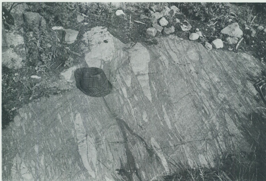
Fig. 2. Monomikt vulkanisk breccia med brottstycken av kvartsporfyr inbäddade i en biotitrik grundmassa med betydande inslag av plagioklas och kvarts. – Gustavsberg, S om Nolsterby (Grisslehamn NV, 6a).

ofta med surare fragment, mestadels i cm- till dm-skala, inbäddade i en intermediär till basisk grundmassa (fig. 2). Sådana fragmentbergarter finns såväl öster om Börstils (Östh. NO, 6 i) som Hargs kyrkor (Östh. NO, 5 i), i sistnämnda område ingående studerade av Beyer (1954). Även ett grovt konglomerat har påträffats i den av sura vulkaniter uppbyggda Vattholmasynformen (Östh. SV, 1 b). Konglomeratet innehåller endast en typ av bollar (dm-stora kvartsporfyrbollar) i en sparsamt förekommande, glimmerrik grundmassa. Avsättningen har skett i marin miljö.