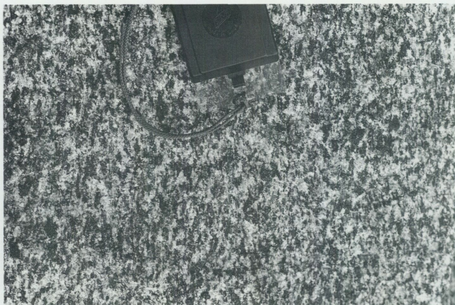
Fig. 11. Granodiorit-tonalit, lätt förskiffrad. – 1.3 km SO Lavarö. (12J Grisslehamn SV).

sta sammanhängande arealer av bergarten finner man sydost om Uppsala stad samt mellan Österbybruk och Gimo.