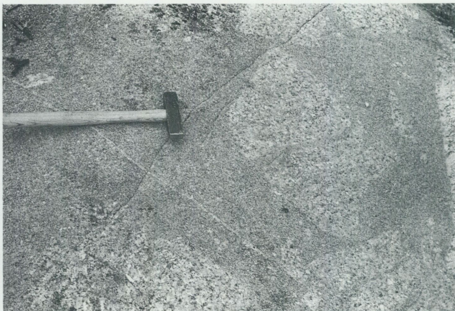
Fig 13. Sur, röd, urgranit breccierad av rödgrå, yngre granit. – 500 m V om sydspetsen av sjön Myssligen, ca 5 km NO om Österåker k:a (Uppsala SO, 0i).