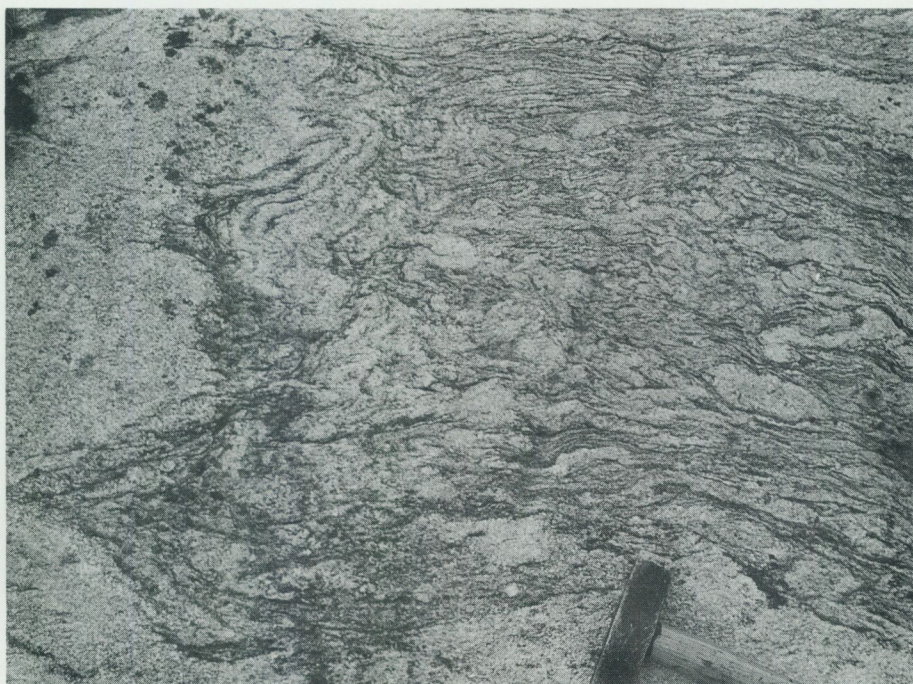
Fig. 8. Sedimentådergnejs konformt inramad av grå, granatförande yngre migmatitgranit (t. v.). – Lövhamraberg, ca 1,5 km SSV om Närtuna k:a (Uppsala SO, 4g).