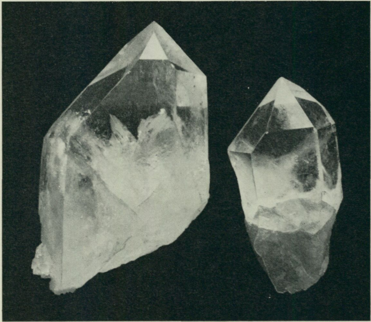
Bergkristall, Offerdal, Jämtland. Skala 3:4. Foto P. H. Lundegårdh 1969.