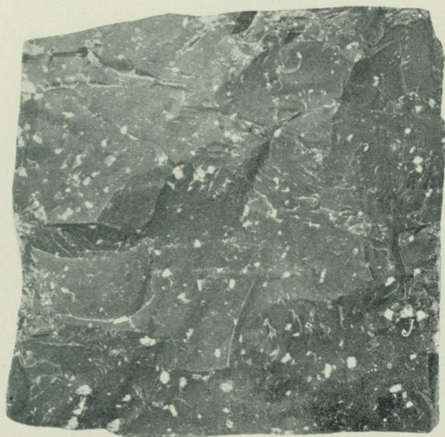
Strökornsfattig Dalaporfyr. Orsa finnmark, Dalarna. Naturlig storlek.

På flera ställen, främst i Blekinge och södra Småland, bryts sprickfattig diabas (vanligen hyperit) under namnet svartgranit till gravvårdar och byggnadssten. I övrigt används diabas för framställning av mineralull och makadam.