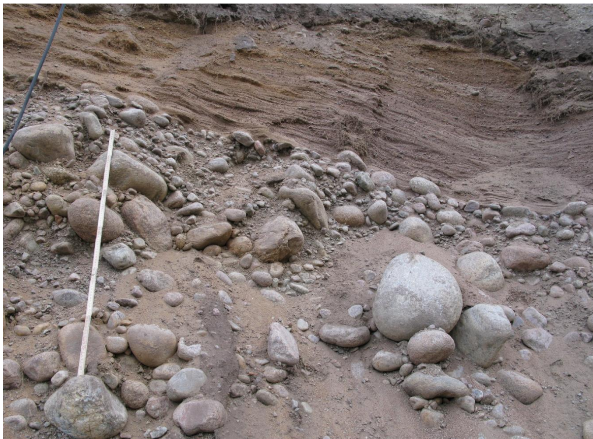
Figur 4. I gropen (Lokal B) som syns i förgrunden på Figur 1 påträffades 1,5 m svallsand-grus på ett grövre sediment, troligen det primära isälvsedimentet. Måttstocken på bilden är 1,2 meter lång.