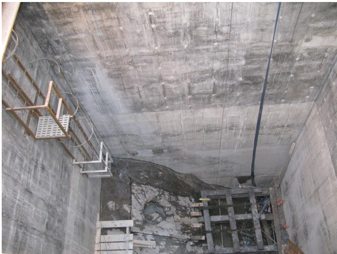
Figur 6. Förutom själva jättegrytan syntes inga tydliga spår av erosion i berggrunden, om man inte räknar med utsågningen av berget som grytan sitter i vill säga.

Enligt tidigare uppfattning bildades jättegrytor av att en löparsten av en hårdare bergart än underlaget sätts i rotation av rinnande smältvatten som kommer genom tunnlar i isen och borrar sig ner i berggrunden. Kritiker mot denna bildningsmekanik (bla Alexander 1932 och www.gletschergarten.ch ) har gjort gällande att det inte är troligt att smältvattentunnlar finns på samma plats tillräckligt länge för att dessa former ska hinna bildas. Den idag rådande uppfattningen gör gällande att kaviteterna uppstått vid erosion av virvlande och strömmande vatten under högt tryck och hastighet. Denna miljö kan förekomma under smältande inlandsisar då syre- och sedimentmättat vatten i mycket hög hastighet virvlar fram genom sprickor i inlandsisen och vid kontakt med den underliggande berggrunden skulpterat ut dessa håligheter.