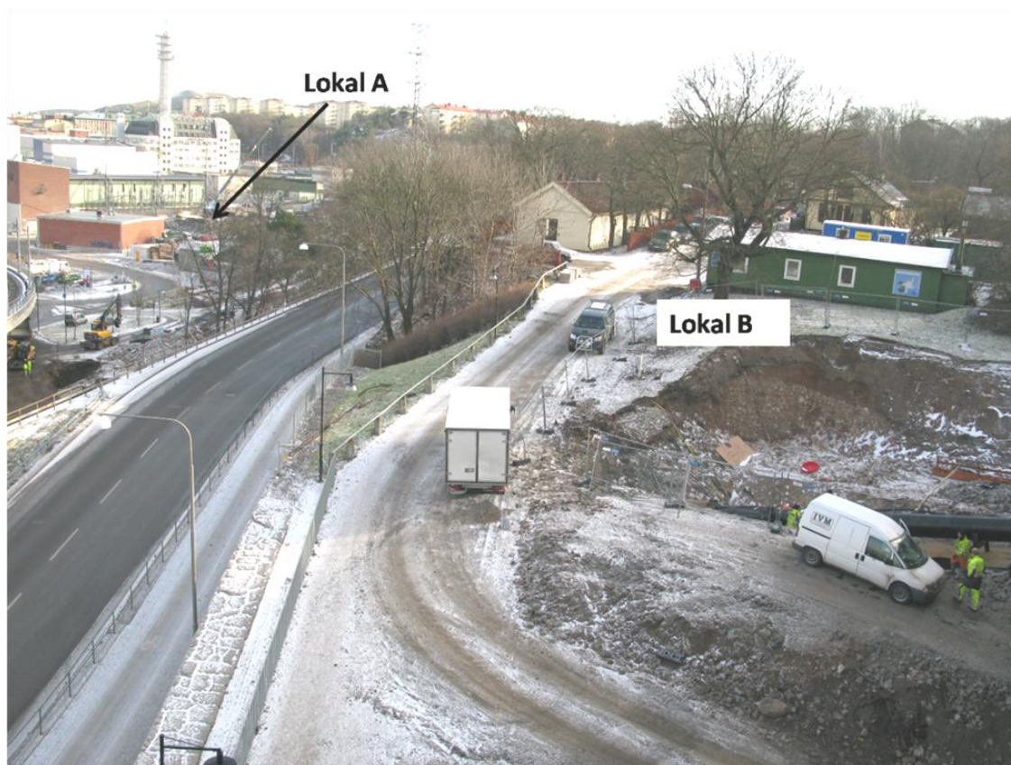
Figur 2. Schaktet där jättegrytan påträffades är beläget framför ställverket i bildens vänstra del, vid den blå lyftkranen, Lokal A . I förgrunden syns ett öppet schakt med postglacial sand i ytan och isälvsediment på djupet, Lokal B i Figur 1. Fotot är taget från Skanstullsbron mot söder.

Lagerföljden vid schaktet är inte fullt ut känd eftersom metallspånt hade monterats utmed väggarna innan SGU kom till platsen i oktober 2008. I kontakten mot berggrunden i botten av det 14 m djupa schaktet syntes dock tydligt ett grovt isälvsediment (Figur 3). Två pumpar arbetade kontinuerligt för att stå emot inflödet av grundvatten. Vid återbesök i februari 2009 hade schaktets väggar gjutits igen och tätats med betong och fyllts ut med fyllnadsmaterial.