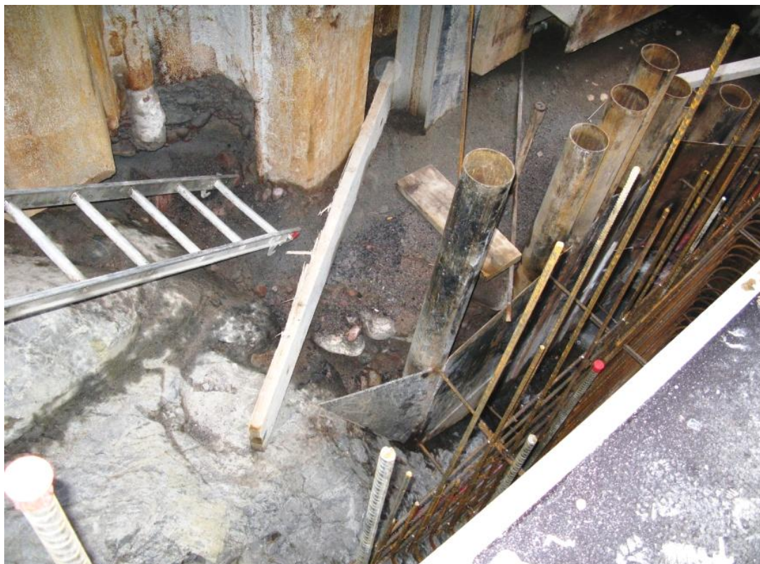
Figur 3. I kanten mellan järnspånt och berget sticker de primära sedimenten fram. Materialet i botten består av ett grovt isälvssediment, mest sten och grus.

I ett intilliggande öppet schakt (Lokal B), ca 100 m nord-väst om Lokal A, påträffades cirka 1,5 meter grusig sand ovanpå >3 m stenigt grus (Figur 4). Den övre enheten tolkas som omlagrat sediment, svallsand, som täcker åsen. Övergången till det grövre materialet i den undre enheten är distinkt men erosion kan ej fastställas. Det undre lagret tolkas som primärt avsatt isälvssediment. Djupet till berg är inte fastställt men hållar finns ca 10 m från schaktet så troligen är bergytan nära botten av schaktet på ca 3 m djup.