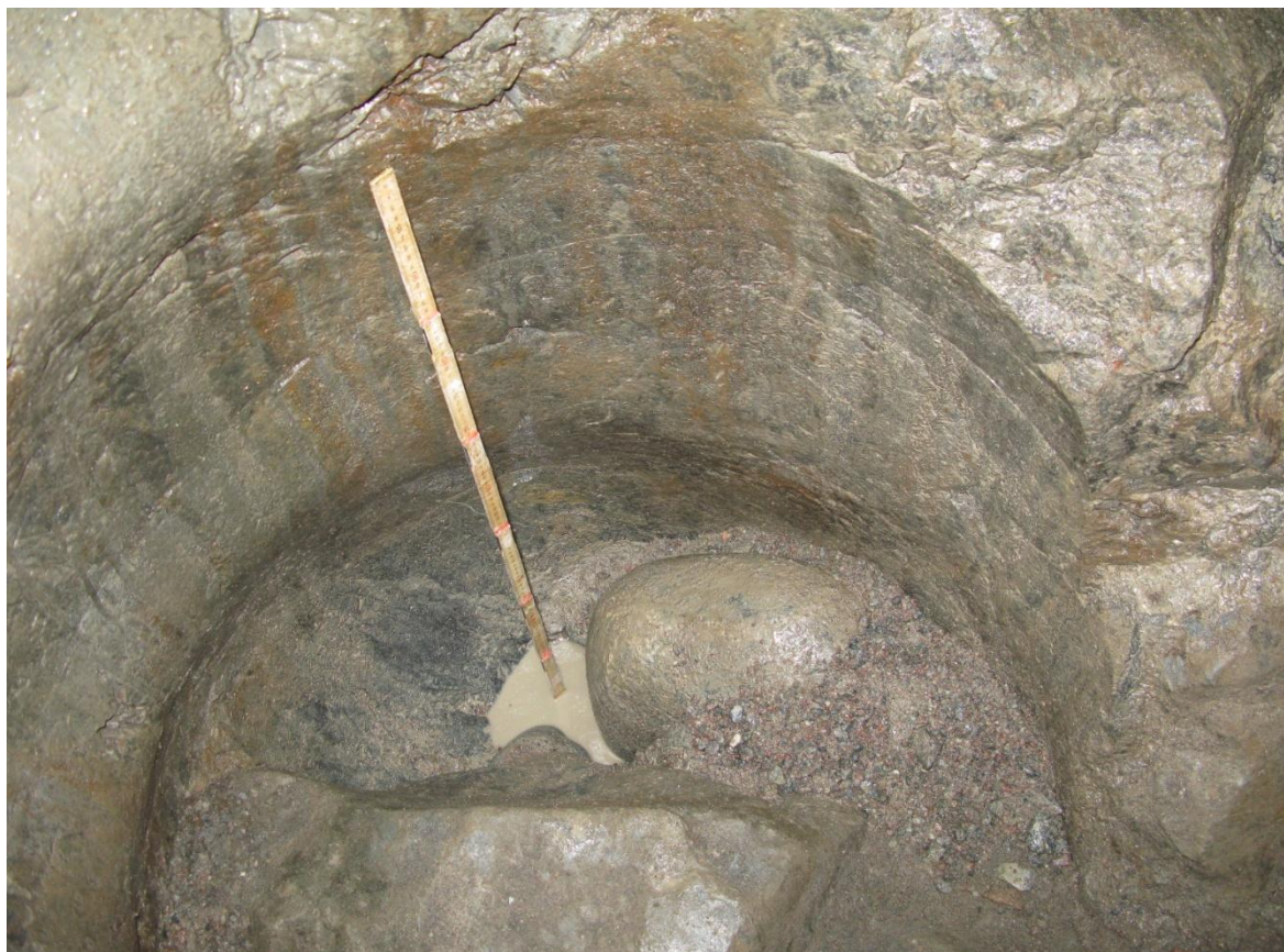
Figur 5. Jättegrytan är 70 cm i diameter i mynningen och 120 cm djup.